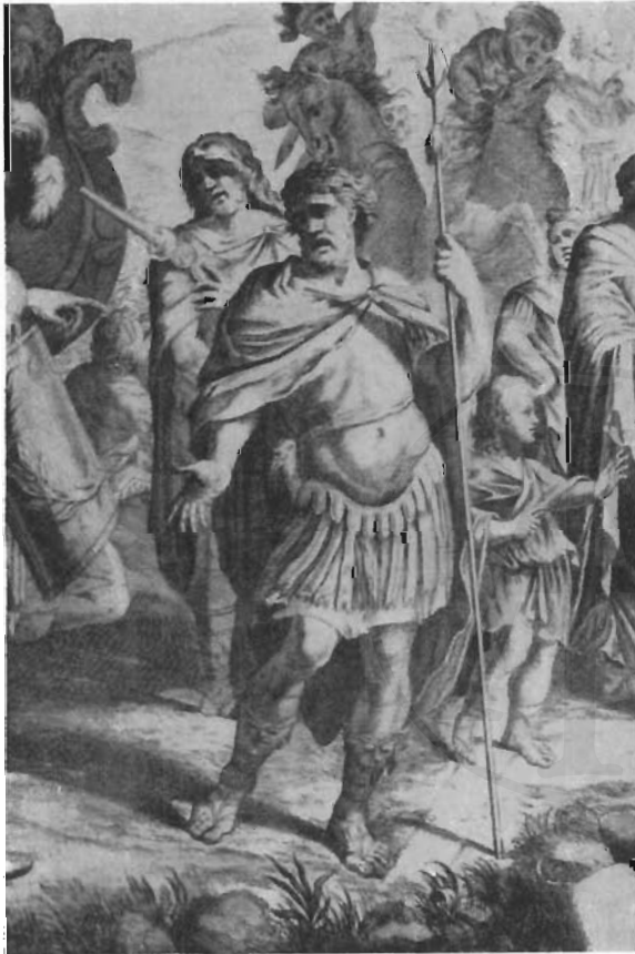
FIG. 11 - FRANCESCO ROSA - Lo sbarco di Agrippina a Brindisi (incisione di C. Fantetti. Particolare).

Del bagaglio archeologico dei suoi studi si ricorderà sempre Francesco Rosa: nella tela di casa Pamphilj egli addirittura trasferisce alla destra del Belisario l'istessa