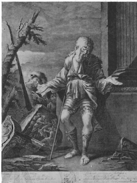
FIG. 12 - SALVATOR ROSA - Belisario (incisione di Robert Strang).

inglese, ma una sostanziale differenza informa le due creazioni artistiche. Nello sfondo del dipinto appartenuto al cardinale Pamphilj lo schianto degli alberi atterrati si mescola, senza turbarla, alla dolcezza accorata del tramonto. E nell'a malinconica scena – sole spettatrici le vive forze della natura – Francesco Rosa ha sorpreso l'esitante avanzare del vinto dal destino. Creatura di grazia, più che di violenza, l'ondula figura del suo Belisario – coi nudi piedi sfioranti il sentiero, con l'accentuato inarcamento del fianco entro la tunica fasciante e le braccia allargate da cui lento piove alle spalle il lungo mantello annodato sul petto – potrebbe indifferentemente essere quella del