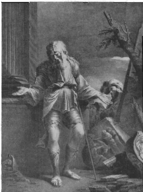
FIG. 13 - SALVATOR ROSA - Belisario (incisione di Cristoforo dell'Acqua).

corrucchiato guerriero che si appoggia all'asta nella incisione di Agrippina (fig. 11), come potrebbe essere – mutata la maschera del volto – quella di un arcangelo in riposo con le grandi ali abbassate sino al suolo (fig. 1).