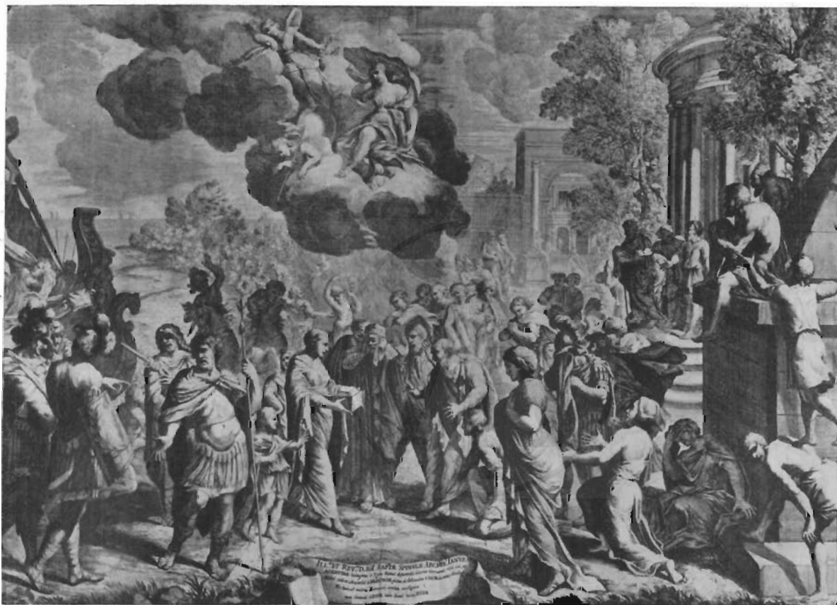
FIG. 10 - FRANCESCO ROSA - Lo sbarco di Agrippina a Brindisi con le ceneri di Germanico (incisione di C. Fantetti).

Nella incisione tratta dal disegno di una tela giovanile di Francesco Rosa, che