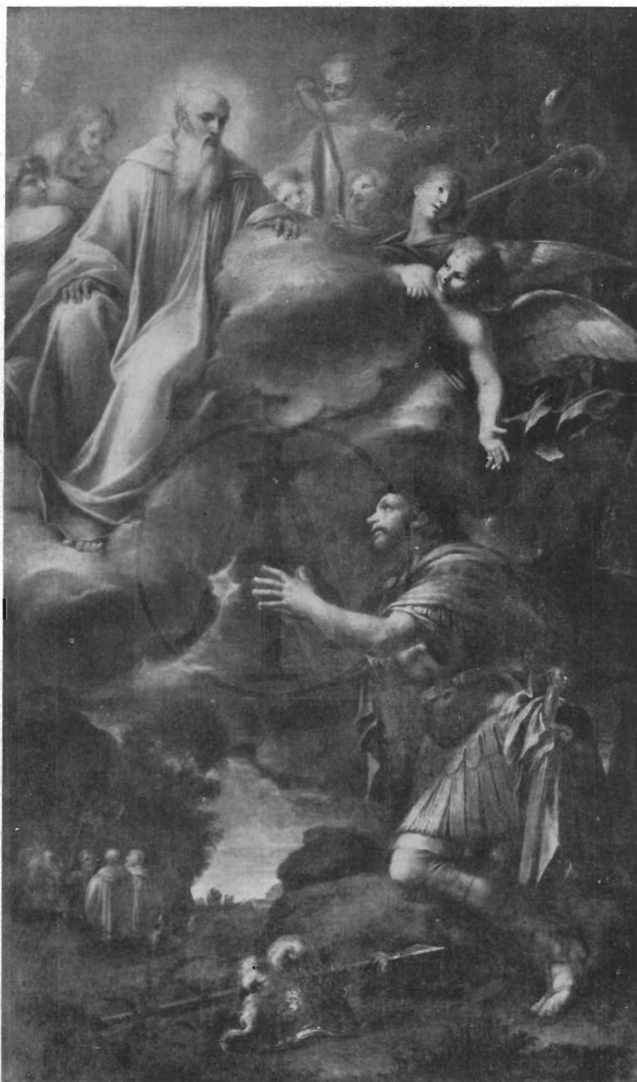
FIG. 3 - ROMA, CH. DI S. CARLO AL CORSO - FRANCESCO ROSA: Sant' Enrico.