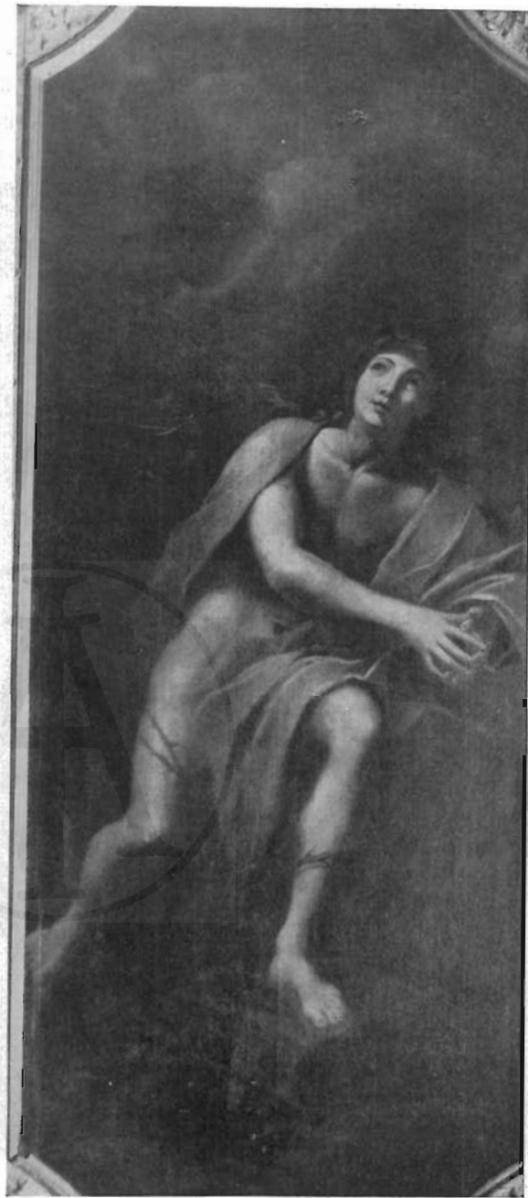
FIG. 7 - ROMA, CH. DI SANT'ANTONIO - FRANCESCO ROSA: La Purezza.