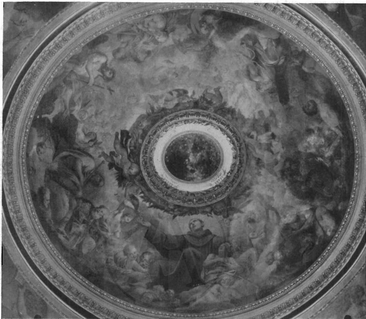
FIG. 6 - ROMA, CH. DI SAN ROCCO - FRANCESCO ROSA: La gloria di Sant'Antonio.

l'artista. La luce, che nel S. Filippo, irrompendo con volo d'angeli nell'interno della cappella, aureola la nobile testa del santo e indugia a trarre dalla pianeta bagliori rosa e oro è la stessa che nel Belisario bacerà la fronte del grande mendico, ne carezzerà le vesti di un pallido rosa, di un livido paonazzo; è la stessa che si diffonde pacata nella tela del S. Enrico con lontane chiarità argentine, e che in una lunetta nella chiesa di San Rocco con la « Morte del Santo di Padova » (fig. 4), la più antica delle opere sue a fresco, occhieggia in un lembo di paesaggio alberato e nubilo assai vicino quello che poi sarà la scena del Belisario. Al quale anche prelude, nella tela del S. Enrico, quel fondo luminoso, con rupi a destra, e a sinistra una macchia di alberi in cui s'ingolfa il corteo dei frati.