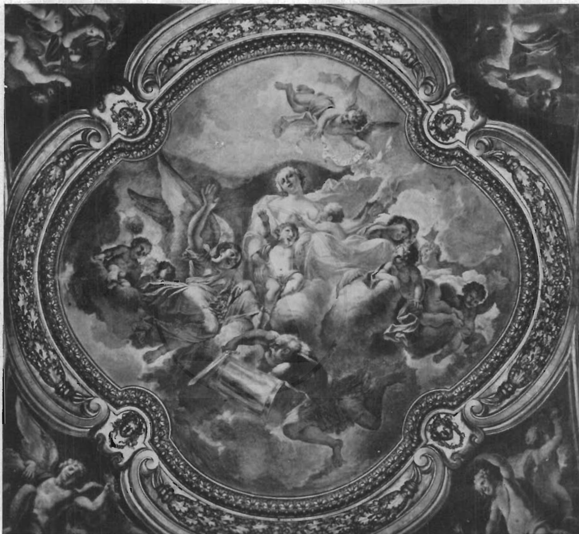
FIG. 9 - ROMA, CH. DI S. CARLO AL CORSO - FRANCESCO ROSA: La Carità.

in ginocchio, volano al cielo come agitate da commozione interna che ne fa vibrare visibilmente la persona. Tale il turbinante tripudio di angeli – di correggesca memoria – nella « Gloria di S. Antonio » affresco in una cupoletta della chiesa di S. Rocco (fig. 6) con le quattro « Virtù » nei pennacchi (figg. 4 e 5), che, seminude e procaci, più