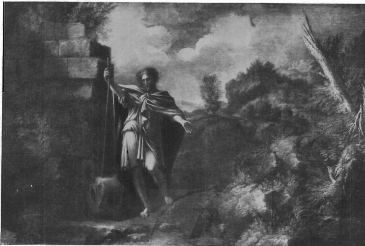
FIG. 1 - ROMA, PALAZZO PAMPHILJ - FRANCESCO ROSA: Belisario cieco.

Con gli stessi dati e, in più, il nome dell'autore, il dipinto è così additato nell'Inventario Generale del 1725 « Nella terza stanza al Cantone del Secondo Appartamento del Palazzo al Corso... Paese con Figurina in piedi con Bacchetta in mano mis. 8 p.mi e 12 incirca dipinto da Francesco Rosa cornice liscia dorata segnato del n. centonoantuno » 6) . Identici nei due inventari il numero di catalogazione, il soggetto e le misure che collimano con quelle della tela del Belisario cieco pervenuta di eredità in eredità alla Galleria del Principe Doria dal cardinale Benedetto Pamphilj.